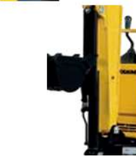
ブームシリンダーガード