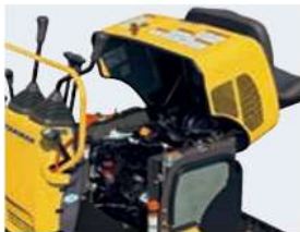
フルオープンボンネット