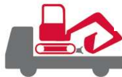
2tユニックで 簡単吊り上げ・運搬